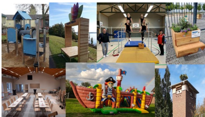
In den Jahren 2021 und 2022 sind bereits 42 Kleinprojekte umgesetzt worden.