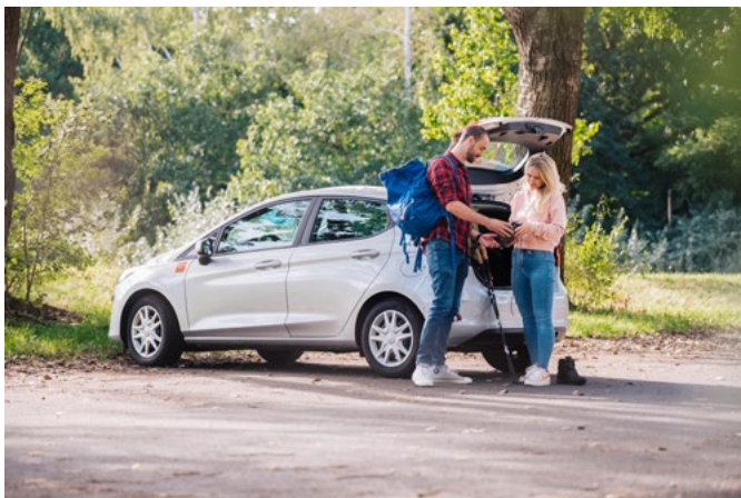
Ab September gibt es in Zülpich wieder ein Carsharing-Angebot. Dann werden am Bahnhof und am Adenauerplatz jeweils zwei Kompaktfahrzeuge für die zeitlich begrenzte Nutzung zur Verfügung stehen.

cambio Rheinland ist Teil der gleichnamigen Unternehmensgruppe, die im Jahr 2000 aus den Anfang der 1990er gegründeten Carsharing-Initiativen in Aachen, Bremen und Köln hervorging und heute 190.000 Kunden in mehr als 100 Städten in Deutschland und Belgien mit individueller Mobilität versorgt. Ihre Kompetenz als Carsharing-Anbieter fußt also nicht nur auf mehr als drei Jahrzehnten Erfahrung, sozusagen seit Beginn des kommerziellen Carsharings in Deutschland, sondern auch auf der Größe und Routine der gesamten Unternehmensgruppe. An 1.600 Stationen betreibt cambio 4.600 Fahrzeuge.